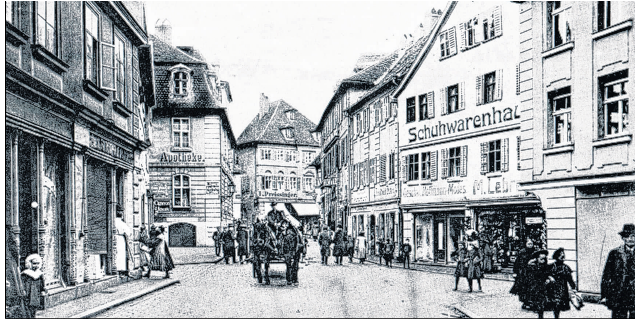
Das Schuhgeschäft der Familie lag in der Uzstraße (im rechten Bildmittel).

Die drei Familienmitglieder zogen in den nun folgenden Jahren häufig in München um. Als letzte gemeinsame Adresse ist nach Angaben des